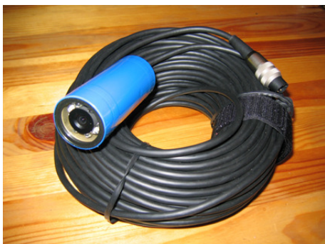
Abysse4 , 6 LED blanches ou IR (câble vidéo max 100m)

Capteur haute résolution, 550 lignes / étanche à -50 mètres Avec éclairage LED blanches