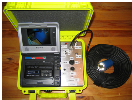
Valise d'enregistrement pro de terrain